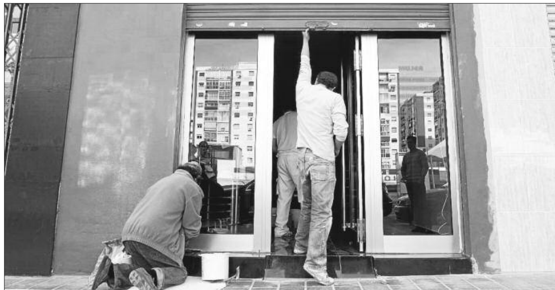
Un empresario prepara la puerta de su negocio.