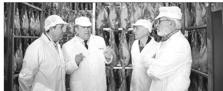
Una imagen de la visita a Famadesa.

«El almacenamiento privado de productos porcinos y su retirada temporal del mercado se antoja por tanto necesaria para restablecer el equilibrio y aumentar los